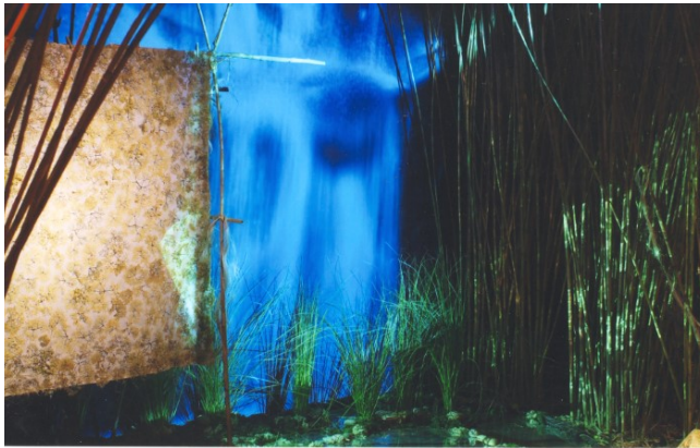
Dones d'aigua.