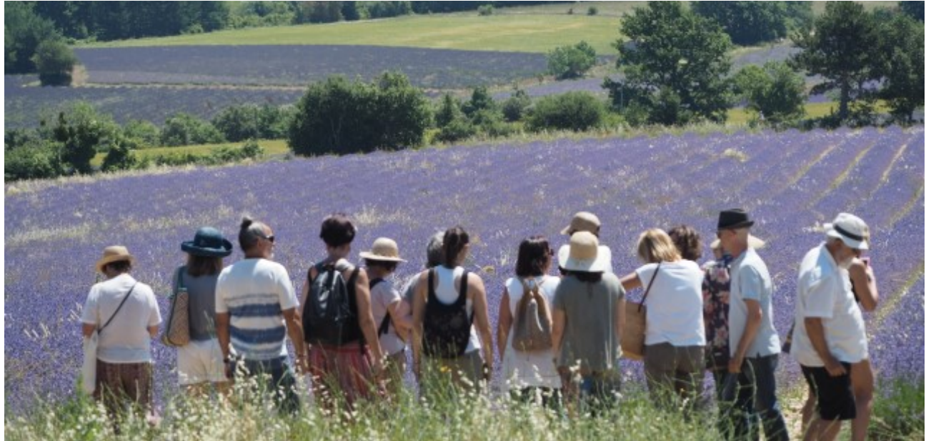
Plateau de Sault (França).

Viatjar és fàcil avui en dia, en un moment podem comprar bitllets d'avió, reservar hotels, etc., però conèixer el país a través de la gent del lloc és molt més difícil.