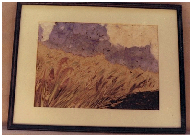
Quadre i llums fets amb composicions de plantes.