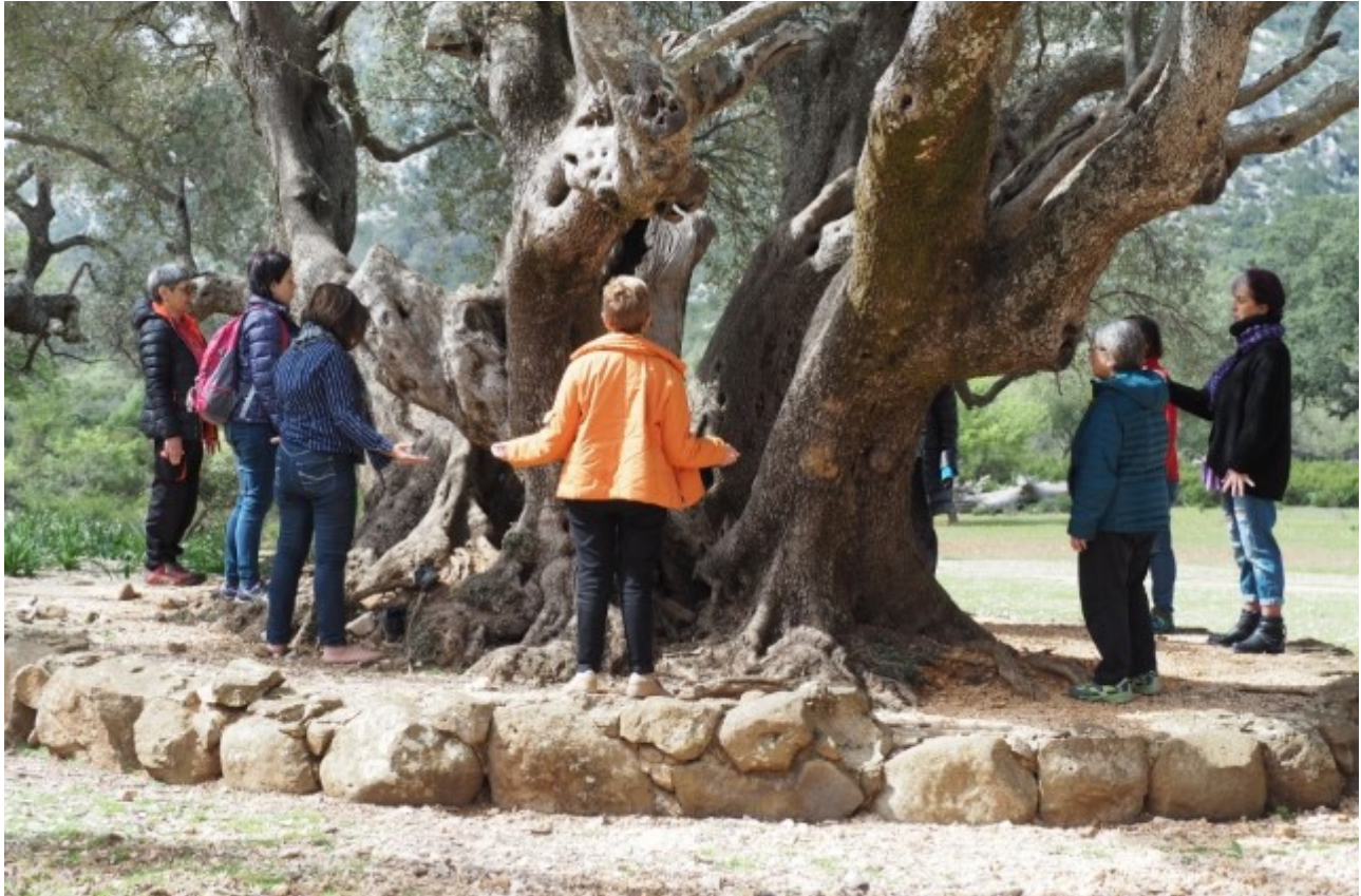
Taller de meditació al voltant d'oliveres centenàries a l'altiplà del Golgo (Sardenya).

Una de les seves publicacions parla de les dones d'aigua. Qui són aquestes dones? Ens en pot fer cinc cèntims per a aquelles persones que no n'han sentit mai a parlar?