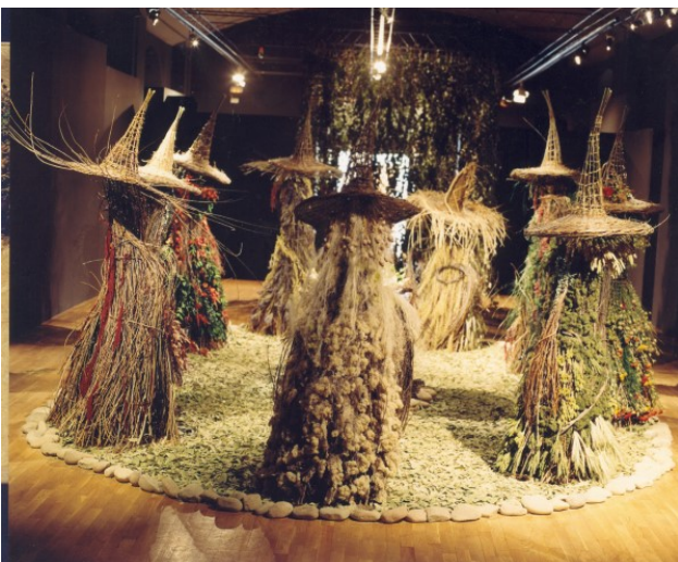
Les flors de les bruixes.

Bàsicament treballàvem amb les plantes que cultivàvem al jardí. Observàvem i triàvem les espècies que ens interessaven més per les seves formes i co-