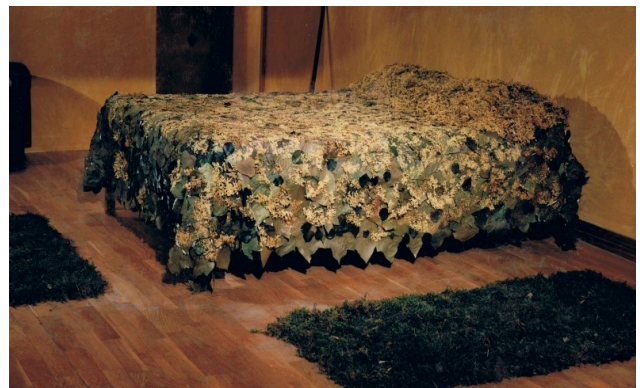
Vànova de saüc.

Actualment explico els usos de les plantes a través de tallers, on mostrem in situ on creixen. És