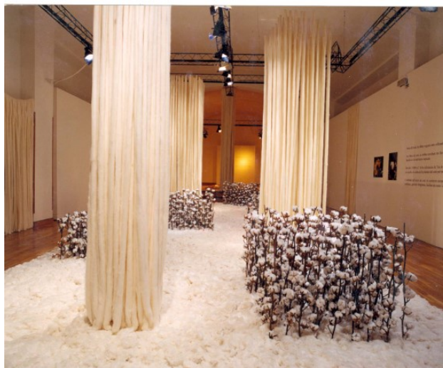
El teixit del món.